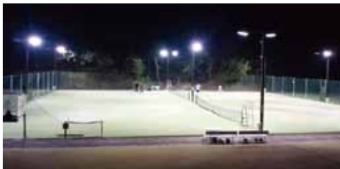
ナイター営業も行っております